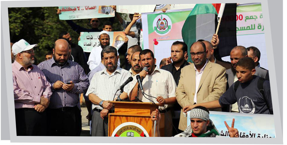
جانب من وقفة تضامنية مع القدس نظمتها وزارة التعليم والأوقاف

نظمت وحدة القدس بوزارة التربية والتعليم العالي عدة مهرجانات مدرسية ووقفات تضامنية وأنشطة في المدارس الحكومية والتعليم تحرص على تنظيم المهرجانات والوقفات الاحتجاجية و توظيف الإذاعة المدرسية إضافة إلى استثمار المنهاج