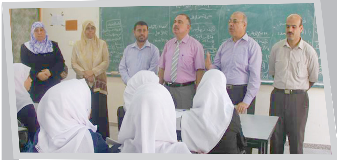
الرملة الثانوية إلى جانب عدد من المرشحات و طالبات المدرسة.