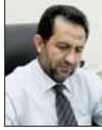
بقلم أ. عماد الحديدي كاتب ومختص تربوي

التمويل هو شريان حياة الدول، وعمودها الفقري، وهو العملية الأساسية التي تستند عليها الدول النامية، مما يبقها تابعة للدول الغنية والمتقدمة، وذلك لما للتمويل من أهداف سياسية واقتصادية، تظهر في صورة المنح والقروض والهبات التي تمنحها تلك الدول للنامية، وتعتبر السلطة الوطنية الفلسطينية من أكثر الدول التي تعتمد على التمويل الخارجي لاقتنارها للموارد الذاتية والإنتاجية، وتنفق الحكومة على التعليم حول المتوسط العام (18%) وهي نسبة متدنية بالقياس إلى احتياجات هذا القطاع من الإنشاءات والتجهيزات، حيث تشكل الرواتب والأجور الجانب الأكبر من إجمالي الإنفاق على التعليم العام بكافة مراحله إذ تتراوح نسبتها في المتوسط من إجمالي الإنفاق حوالي (88%).