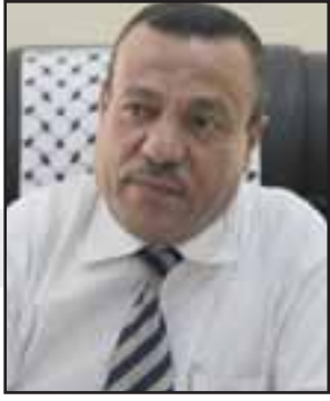
بقلم د. خليل عبد الفتاح حماد مدير عام التعليم الجامعي