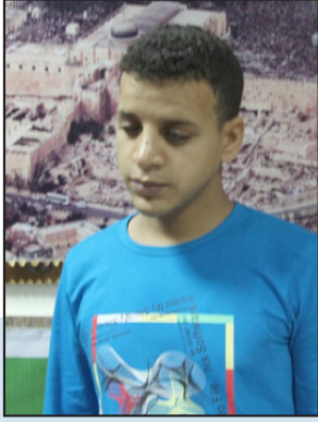
الطالب جنديّة: أطمح لأكون قاضيًا