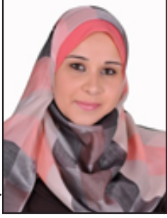
إعداد / أ. هناء محمد الجاروشة مدرسة الرملة الثانوية

11. تغيير حجم النص : لتكبير النص الموجود على صفحات ويب أو تصغيره، اضغط فوق القائمة عرض، ثم فوق حجم النص ثم اختر الحجم الذي تريده 12. شغل الكيبورد على الشاشة اذهب الى ابدأ ثم تشغيل واكتب الأمر OSK يظهر الكيبورد على الشاشة . 14. هناك هاتف في الكمبيوتر انظر كيف تشغيله اذهبي الى ابدأ ثم تشغيل واكتب الأمر dialer 15. تكبير الخط من خلال الماوس أولا : لا بد أن يكون لديك فأرة وسكرول ( السكرول هو : الجزء الدائري في وسط الفأرة من فوق ) إذا أردت أن تكبر الخط ما عليك سوى الضغط المستمر على Ctrl ثم تحركي السكرول الى أسفل ، وسوف تلاحظي الخط يكبر شيئا فشيئا ... وإذا أردت تصغير الخط .. فما عليك إلا أن تضغط على Ctrl باستمرار وتحرك السكرول الى فوق وسوف تلاحظ أن الخط يصغر شيئا فشيئا.