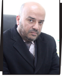
إعداد: المشرف التربوي د. جواد محمد الشيخ خليل