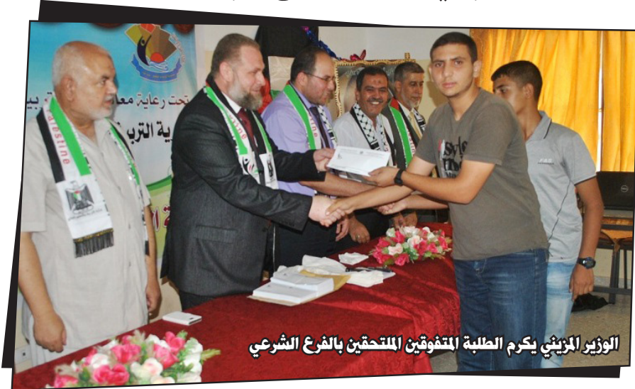
الوزير المزيني يكرم الطلبة المتفوقين المتقدمين بالفرع الشرعي