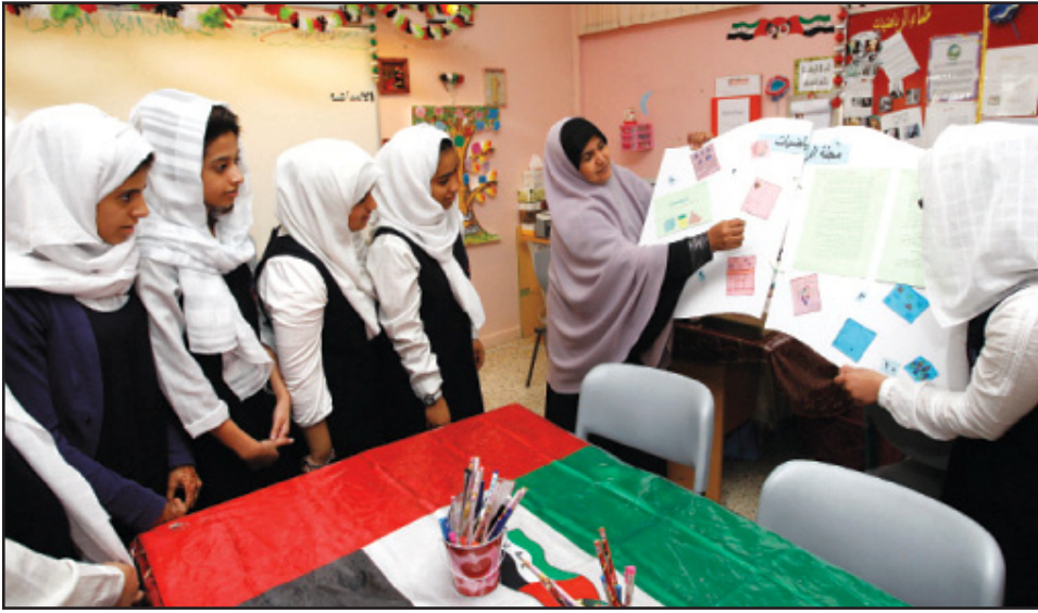
غزة - صوت التعليم

من الضروري أن نسلّم بأن الإنسان مخلوق مفكر يستخدم اللغة، ولكي يصل الإنسان إلى هذا الوضع فلا بد أن يعيش خبرات حياتية يتعلم من خلالها بشتى أساليب التعلم أموراً تعتبر بالنسبة له دستوراً يهتدى بها في حياته، وجزء مهم من عملية التعلم أن يكون هناك معلم حتى لا يطول الطريق وتتكرر الأخطاء.