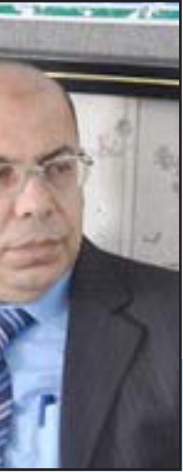
د. غنيم : الرئيس لكل الأقسام والإبدي