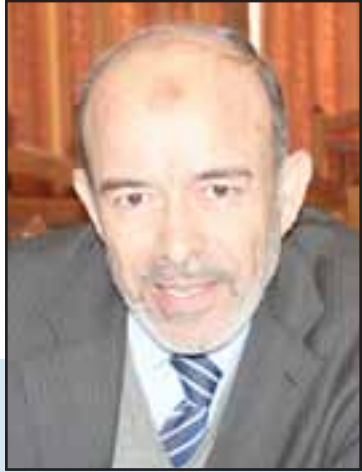
د.رزقة: نركز على توثيق الصلات بالمجامع والهيئات اللغوية والعلمية